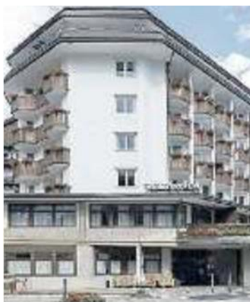
IN CENTRO L'albergo Alaska

offrono un'esperienza autentica e un servizio personalizzato, con l'obiettivo di rispondere al meglio alle aspettative di una clientela internazionale esigente. L'Italia, con il suo patrimonio culturale, la bellezza paesaggistica e l'eccellenza nel settore dell'ospitalità, rappresenta una destinazione di grande richiamo per questa fascia di mercato. Il nostro obiettivo è continuare a crescere e prosegue la ricerca di strutture in linea con i nostri standard, anche per offrire un ricco ventaglio di scelte per i nostri clienti».