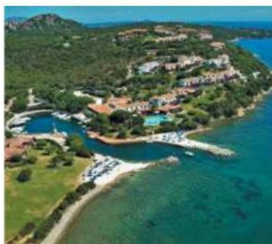
L'Hotel Palumbalza di Porto Rotondo

Uvet Hotels, in ottica di continuità operativa, ha deciso di confermare l'organico degli hotel, pari a oltre 200 persone.